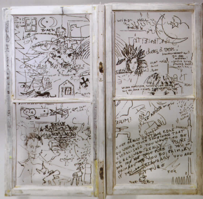
Images (c) Faksimile Digital Vienna, DI Jeff Wolf Leeb, Michael Wegerer