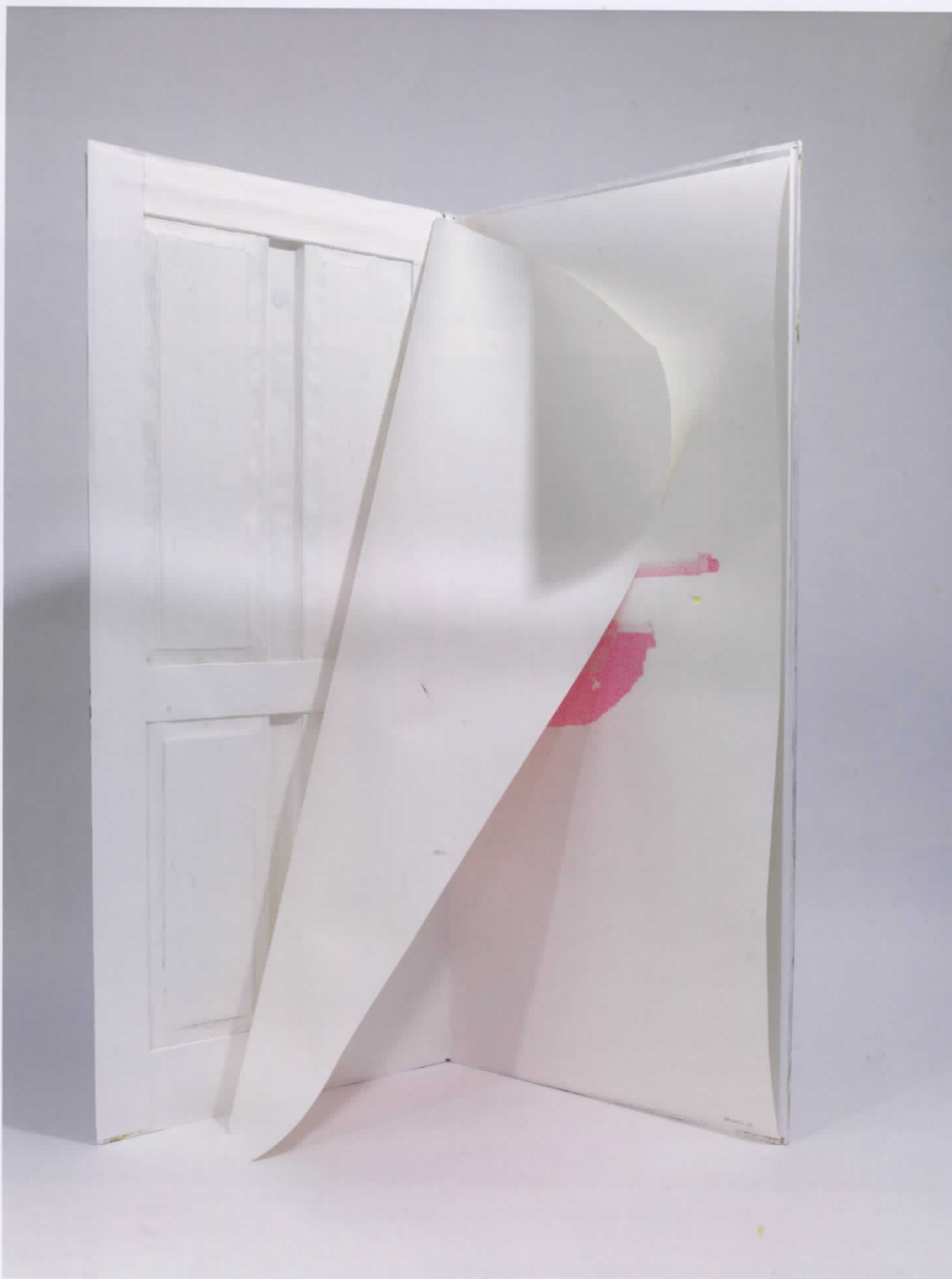
Images (c) Faksimile Digital Vienna, DI Jeff Wolf Leeb, Michael Wegerer