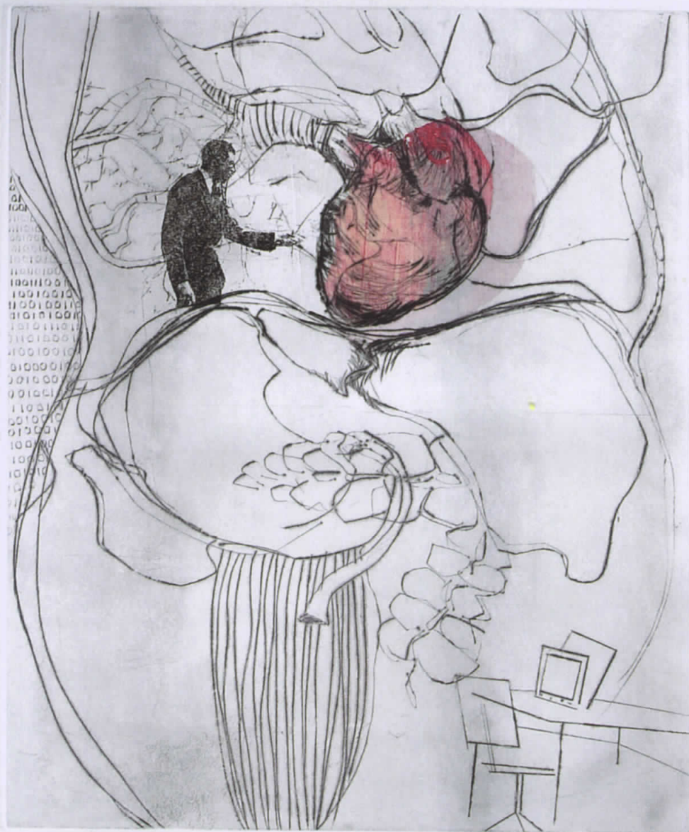
Images (c) Faksimile Digital Vienna, DI Jeff Wolf Leeb, Michael Wegener