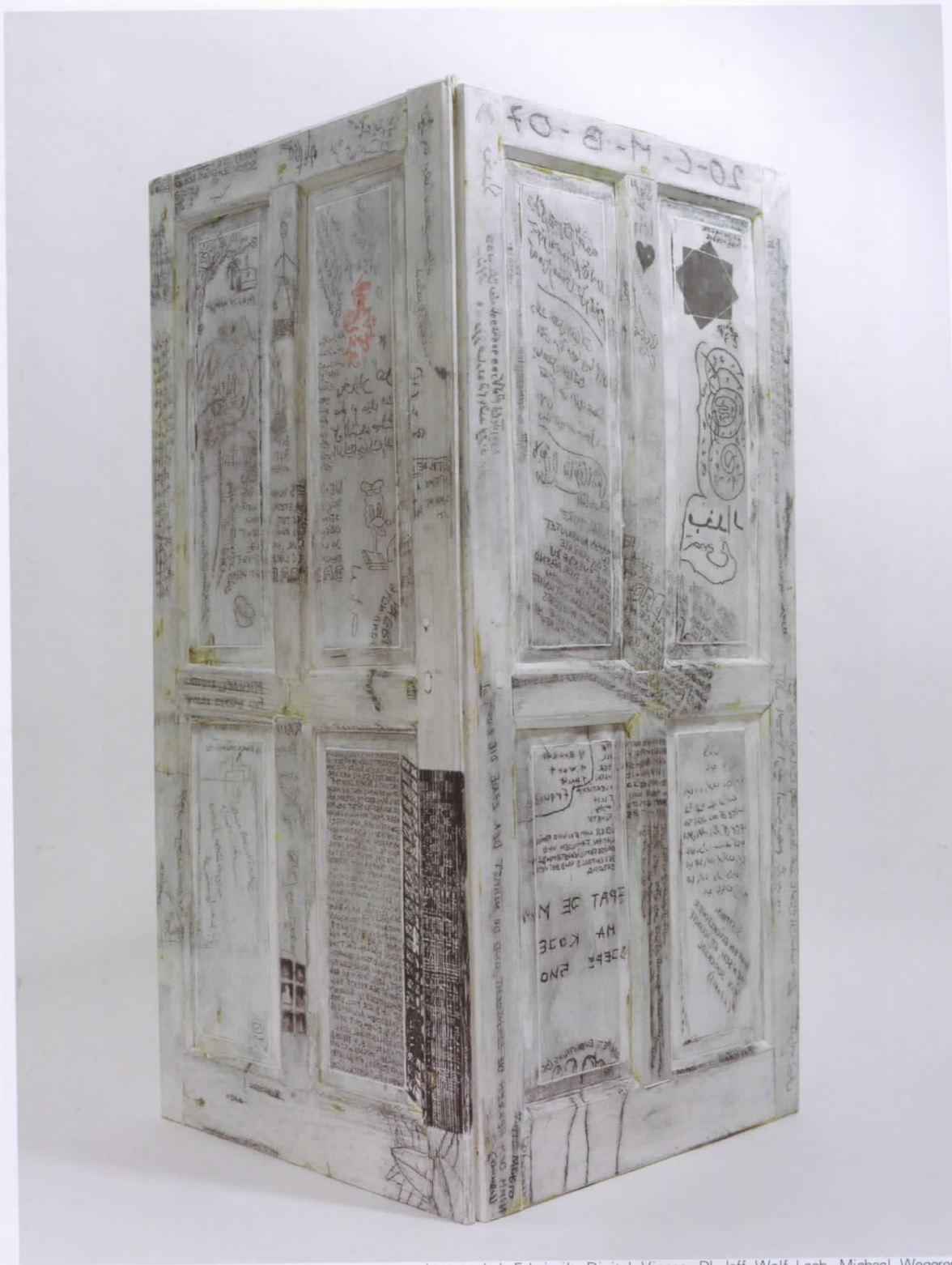
Images (c) Faksimile Digital Vienna, DI Jeff Wolf Leeb, Michael Wegerer